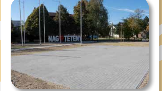
39 A Nagytétényi Piac tér fejlesztése

Az ötlet keretében megújult a Nagytétény központjában található Szent Flórián tér. Nőtt a zöldfelület, fákat és cserjéket telepítettek, kiselemes térburkolat épült, mely a hagyományos nagytétényi szüreti néptáncbemutatóknak biztosít ideális helyszínt. Embernagyságú NAG TÉTÉNY feliratot is kihelyeztünk.