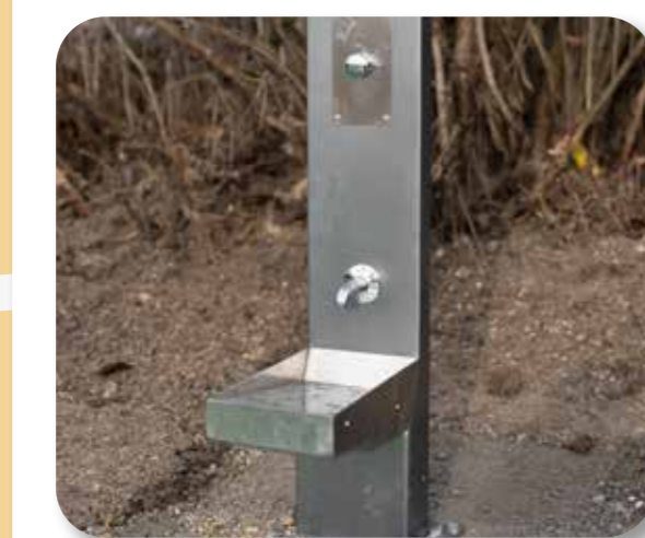
32 Ivőkút a Tétényi-fennsíkon

A projekt részeként a Szoborpark szomszédságában megépült kondipark mellett egy ivőkút jött létre, mely ideális ivóvízvételi hely a sportolók, kirándulók, futók számára a nyári melegben.