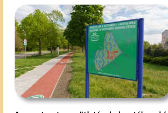
24 Rózsakerteri Sportcentrum – Futókör

A sportcentrum ötletének keretében két évad alatt a Rózsakerteri lakótelep körül létesült egy rekortán borítású futópálya, melynek teljes hossza 1,5 kilométer, a magasságkülönbség pedig 19 méter. A futókör építése során a rekortán pályarészek mellett a járdaburkolatok is megújultak; felfestették a burkolati jeleket, illetve kihelyezték a forgalomtechnikai táblákat.