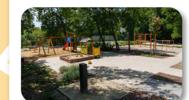
29 Mézesfehér utcai projekt

A projekt keretében az utca épületeinek főbejáratánál húzódo sétány burkolati javítása, a vízvezető árkok és a sétány világításának felújítása, a lépcsők és a támfalak helyreállítása, a parkolók felfestése, a területen lévő játszótér teljes felújítása, a garázsor előtti útszakasz, valamint a parkoló burkolatának javítása valósulhatott meg.