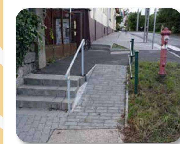
36 Járda akadálymentesítése a Huncutka óvodánál

Az ötlet megvalósítása során a Rákóczi úton, a Tüzliliom utca sarkától a Park utca sarkáig, a Huncutka óvoda előtti szakasz vált babakocsi- és egyben kerekesszékek-baráttá. A járda akadálymentes lett és új burkolatot kapott.