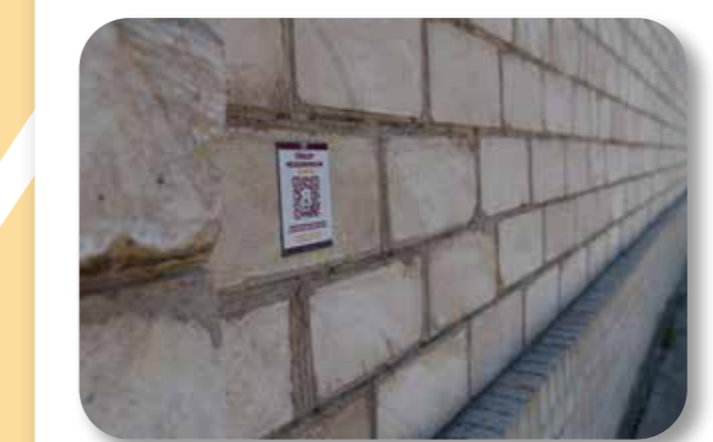
25 QuilR22 (Teljes kerület)

A projekt célja Budafok-Tétény helytörténetének bemutatása rövidfilmeket keresztül, amelyeket a nevezetességekhez telepített táblákra helyezett QR-kód segítségével érhetünk el. Az ismeretterjesztő videó megtekintéséhez internet-hozzáférésre és az okostelefonunkra van szükség. A QR-kódok Budafok-Tétény nevezetességei, érdekességei mellett érhetőek el.