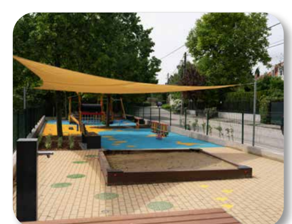
27 Rózsavölgy Honfoglalás úti játszótér felújítása

Az ötlet célja a Rózsavölgyben található Honfoglalás úti játszótér felújítása, eszközeinek cseréje, javítása, a terület bővítése. Számos új eszközt telepítettünk, a burkolatot kijavítottuk, napvitorla került a homokozó fölé, padok lettek kihelyezve.