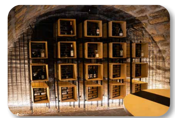
23 Közösségi Pince, bortrezor

Az ötletgazda borászati, gasztronómiai, kulturális és közösségi programoknak otthont adó közösségi teret kívánt létrehozni a kerületben. A Promontorium Borlovagrend 2024-ig szervezi itt a kerületi lakosok számára többségében ingyenes ismeretterjesztő, közösségépítő programjait a Magdolna Udvarban kialakított helyiségben.