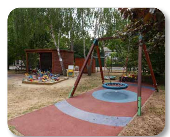
35 Az Elza utcai játszótér korszerűsítése

Az ötlet célja az Elza utcai játszótér felújítása, fejlesztése, új játszóeszközökkel való kiegészítése. A felújítás során megújult a kerítés, kerti tároló és esőbeálló készült, illetve elsőként a kerületben itt helyeztek el baba-mama padot.