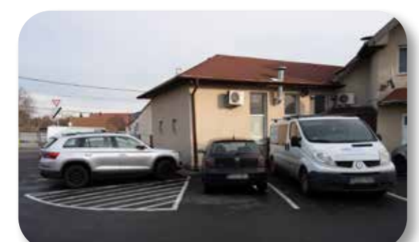
31 A Jókai utca–Nagytétényi út északnyugati sarok rendezése

Az ötlet keretében kerületünk egyik legforgalmasabb pontjának rendezése valósul meg. A parkolóhelyek felfestése megtörtént, a Nagytétényi úti öntött aszfalt burkolatú járdá és az üzletsor kerítése közötti terület újítjuk fel, építjük át. A munkák során támfalat alakítottunk ki, valamint zöldítéssel és fák telepítésével folytatódna a környezetrendezési munkák.