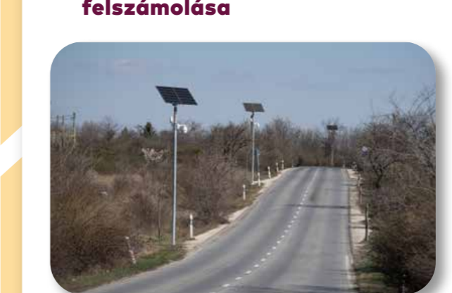
33 Tisztítsuk meg a kerületet! – A kamaraderdei türelmi zóna felszámolása

Az ötlet a kamaraderdei türelmi zóna problémáját hivatott megoldani kamerák és „Padkán megállni tilos” táblák felszerelésével, a rendőrséggel is együttműködve. A projekt kapcsán lakossági megkeresés is érkezett, mely önkéntes szemétszedési akcióra irányult.