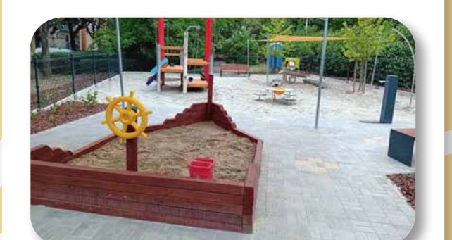
30 Vizes játszótér Budatétényben

A projekt keretében a Rózsakerteri lakótelepen, egy ligetes kialakítású zöldfelületen sarazós-vizezős játszótérrel alakítottunk ki napvitorlával. A gyerekek új kedvenc helyén játékokat, homokozót, vízpárt témájú képkirakót, a víz körforgását is bemutató oktatótáblát telepítettünk. Párapap, ivőkút és padok is biztosítják az idelátogatók kényelmét.