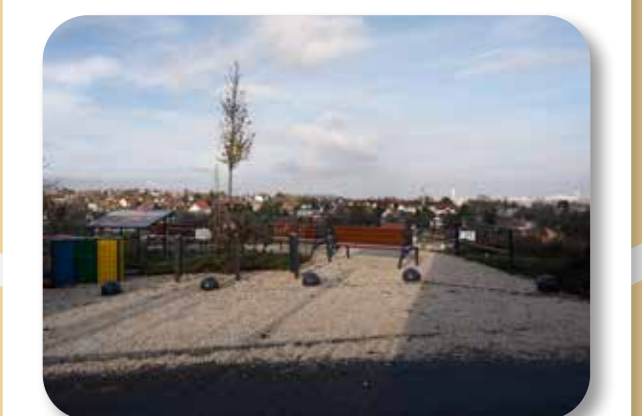
34 Kilátópont Budafokon

Az ötlet célja a Csillag utcában található kilátópont környezetének fejlesztése, biztonságosabbá tétele. A területrehabilitációjára, parkolók kialakítására, zöldfelületfejlesztésre került sor, valamint padokat helyeztünk el, és korlát szolgálja az idelátogatók biztonságát.