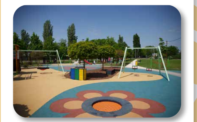
26 Tétény-Rét Családi Park

Az ötlet három évadon át is nyertes volt, célja egy hatalmas játszótér létrehozása az Angeli úton. A családi park, mely a Nagytétényi Sváb Emlékhely területe mellett valósult meg, tematikus játszótérrel, csúszdaparkkal, szabadtéri kondiparkkal, zárt kutya-futtatóval, pingpongasztalokkal, KRESZ-pályával várja a családokat.