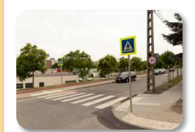
37 Gyalogátkelő telepítése a Gyula vezér út és a Rákóczi út kereszteződésében

A projekt keretében gyalogátkelőhelyt alakítottak ki a Gyula vezér út és a Rákóczi út kereszteződésében a gimnáziumba, valamint a felső területekről az általános iskolába igyekvő gyermekek biztonságos közlekedése érdekében.