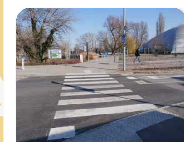
28 Gyalogátkelő a dunafoki játszótérhez

A nyertes ötlet keretében a Duna utca és Hajó utca kereszteződésében létesült gyalogátkelőhely annak érdekében, hogy a játszótérre igyekvő családok közlekedése biztonságosabb legyen.