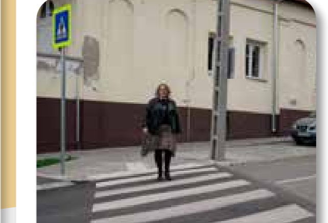
38 Gyalogátkelő a Huncutka óvoda előtt

Az ötlet megvalósítása során a Huncutka óvoda előtt, a Rákóczi út elején gyalogátkelőhely létesült a biztonságos közlekedés érdekében.